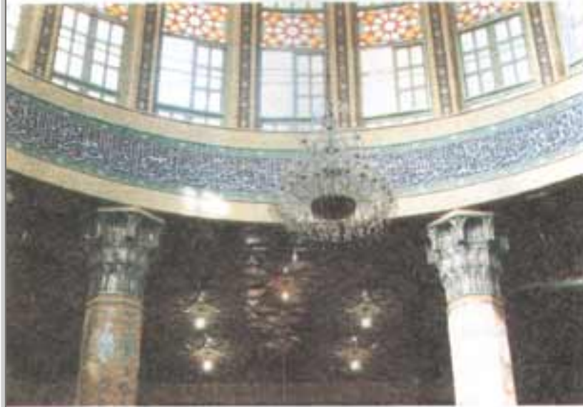
مسجد کے قبة کا اندرونی منظر