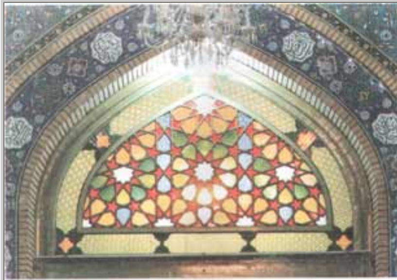
مسجد بکران کاشانی دروازہ