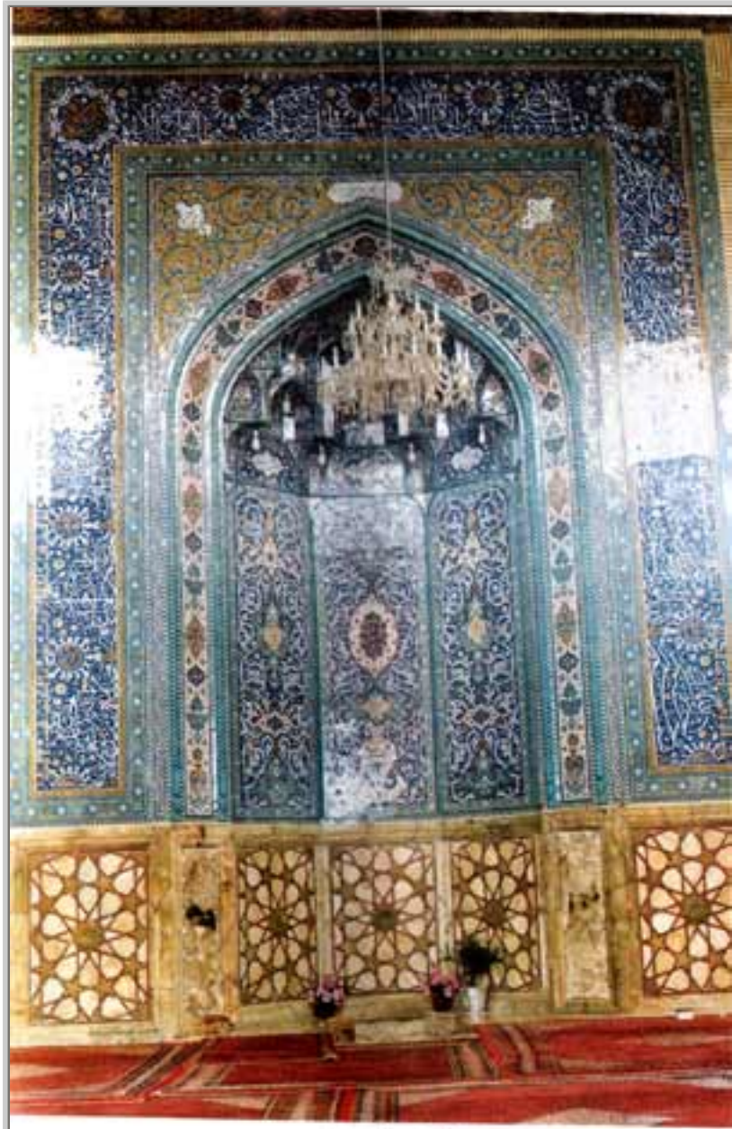
مسجد کا نقش و نگار شدہ محراب